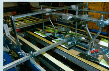
Doppel-Pop-up Verlauf erst über Taschenfalz, dann 3-facher Pflugfalz mit jeweiliger Verleimung + aufschneiden am Schneidetisch + Aufspendung (Einklebung) eines Zugmechanismus.

Um die Kreativität technisch umsetzen zu können, baut Wirtz auf Falzmaschinen und Mailinganlagen u. a. von Herzog + Heymann sowie eine Vier-Stationen-Kuvertiermaschine. Das M7-Falzwerk mit bis zu acht Taschen macht die Produktion der verschiedenen Formate und Varianten möglich. Weitere Bestandteile der Mailingstraße: ein Schneidetisch zum Rillen, Schneiden und Perforieren der Mailings; ein Bändertisch mit Pflugfalz und einer Pick-and-Place-Einheit, um Warenproben aufzuspenden. Es besteht die Möglichkeit, die verschiedenen Leimarten (kalt, heiß und fugitiv) als Punkt, Strich oder in der Fläche aufzubringen. Und auf dem Bändertisch kann Wirtz inline eine Inkjetadressierung an mehreren Stellen des Mailings platzieren. Die Flexibilität unserer Anlagen ermöglicht es, die individuellen Mailinglösungen und dem Kunden ein auf seine Bedürfnisse zugeschnittenes Produkt anzubieten.