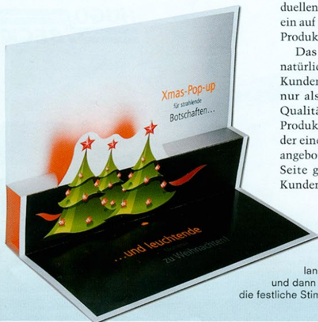
Mailing mit speziellem Leuchteffekt: Unser Pop-up-Mailing stellt Ihre Winterlandschaft im 3-D-Effekt dar. Beim Öffnen überrascht zunächst die Erlebniswelt und dann die integrierte Beleuchtung des Mailings. Der Tageslichtorange-Effekt erzeugt die festliche Stimmung direkt auf dem Schreibtisch Ihrer Kunden.